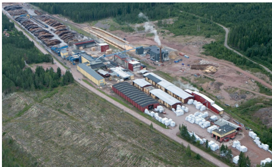
Bergkvist Siljan Blyberg