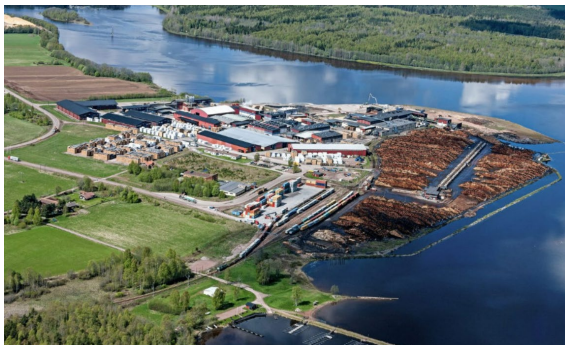
Bergkvist Siljan Insjön, včetně kontejnerového terminálu