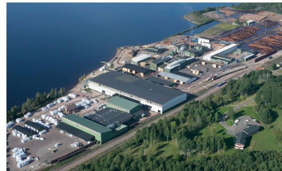
Bergkvist Siljan Mora